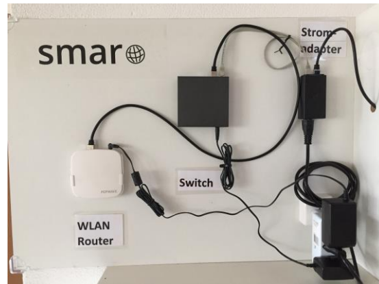
Langstrecken WLAN Antenne

Für eine Beratung stehen wir Ihnen gerne zur Verfügung.